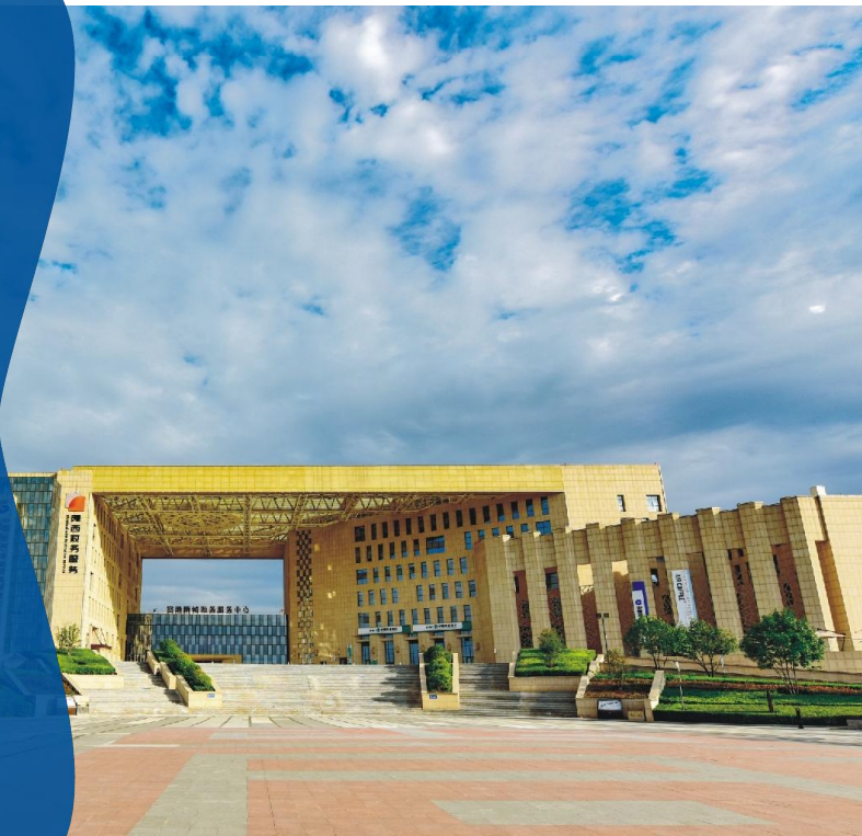
陕西省西咸新区政务服务（空港）中心 2023年6月