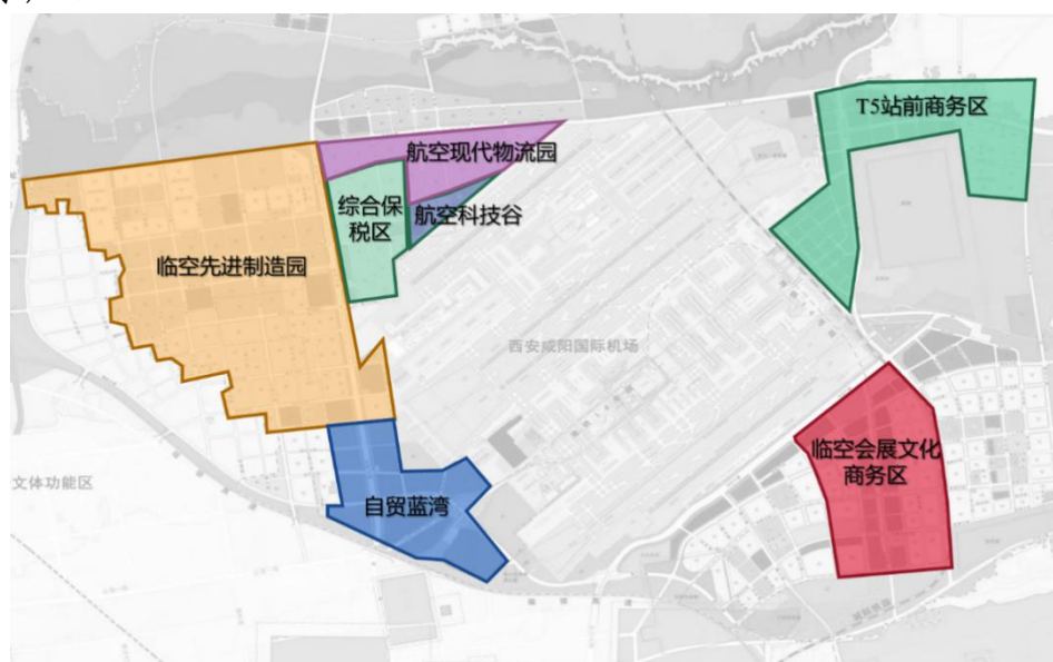
图 4-1：空港新城七大产业发展先导区布局

空科创研发区、临空服贸创新区建设，重点发展智能医疗装备、创新药、临空医疗美容、数字健康管理、智慧供应链平台等新兴产业，加快推动航企总部、航旅服务项目建设。 推进 T5 站前商务区建设 ，依托站前便捷交通优势，对标虹桥商务区，打造集总部、酒店、商贸、消费于一体的临空特色商务区。 推进临空会展文化商务区建设 ，重点集聚临空会展、文化旅游、高端商业、体育休闲等业态。 推进航空现代物流园建设 ，重点集聚航空快递、地面分拨、跨境电商物流、国际中转物流等航空物流产业，推动全球性邮政快递枢纽集群项目建设。 推进综合保税区建设 ，全面完善保税功能，重点集聚航空维修、生物医药、电子信息、跨境电商等产业。